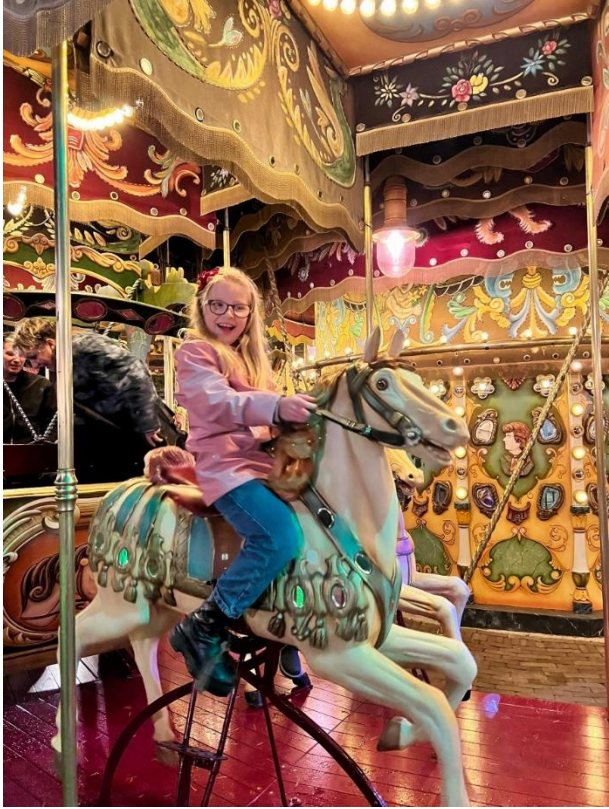
Uitje naar de Efteling met 90 kinderen