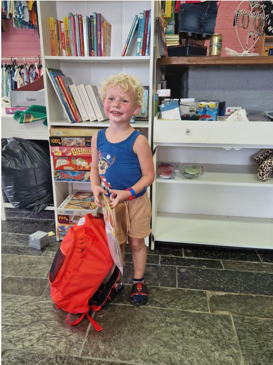
Ties met zijn zomerpretpakket!