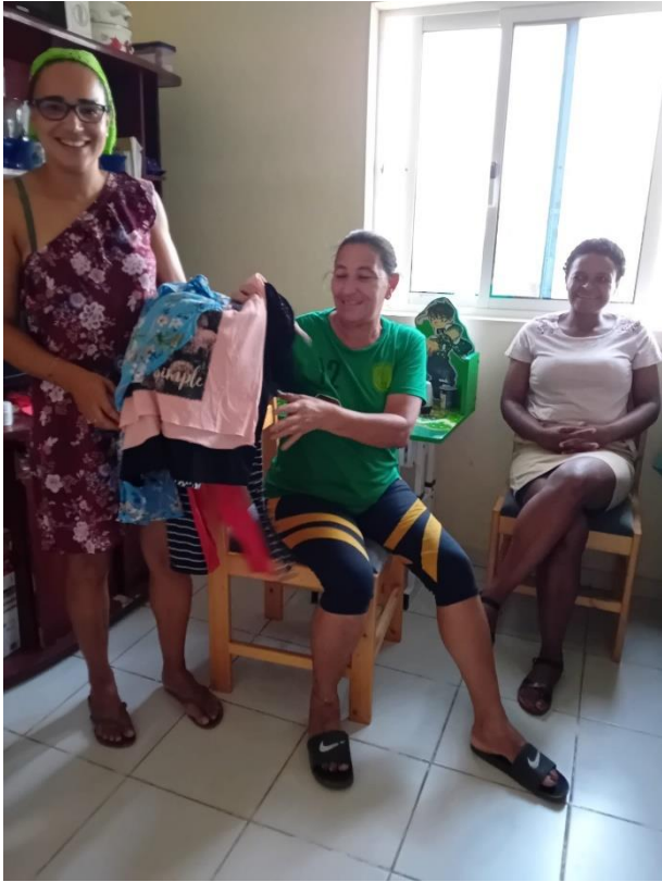
Donaties aan vrouwen en meisjes in Kaapverdië.