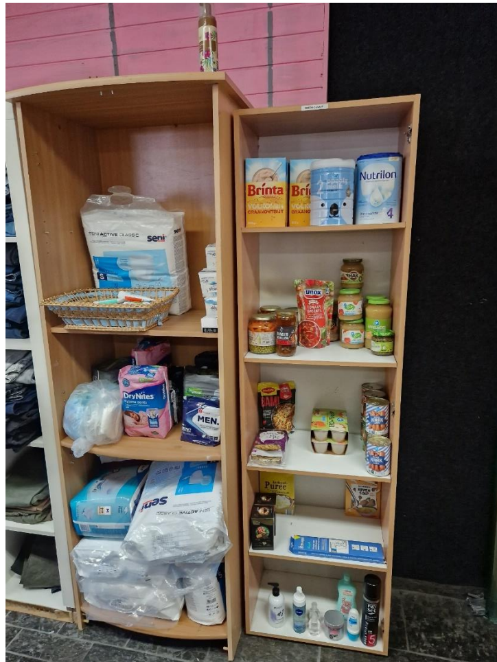
Voedselkast & Menstruatie artikelen en Luiers

Hieronder een impressie van de projecten zoals hierboven geschreven. :