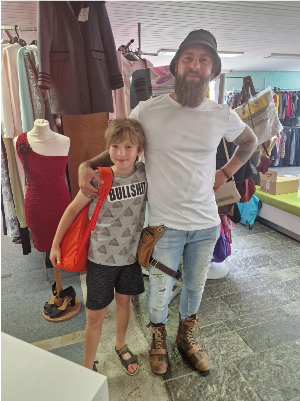
Jegor kwam met zijn vader zijn zomerpretpakket ophalen